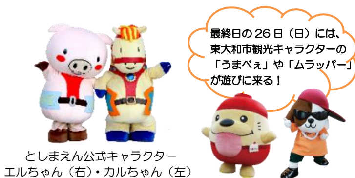
としまえん公式キャラクター エルちゃん（右）・カルちゃん（左）

また6月25日（土）・26日（日）には、パフォーマー達によるバルーンアートやマジックショー、キャラクターのグリーティングなども実施いたします。