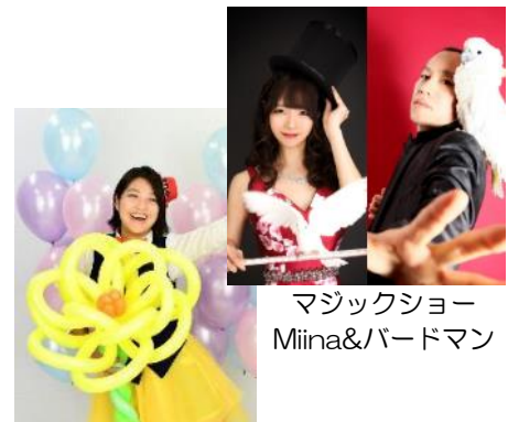
マジックショー Miina&バードマン