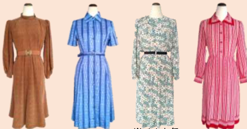
ヴィンテージワンピース参考画像