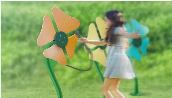
ミュージック・フラワー