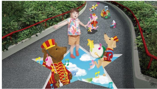
トリックアート・ストリート

花びらをマレットで叩くときれいな音が鳴る「ミュージック・フラワー」は、花びらごとに複数の音があり、みんなで遊べば素敵なハーモニーを奏でる事ができます。