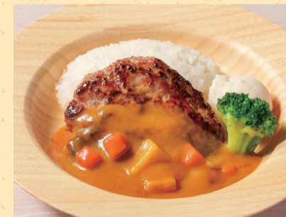
キッズカレーバーグ ¥950