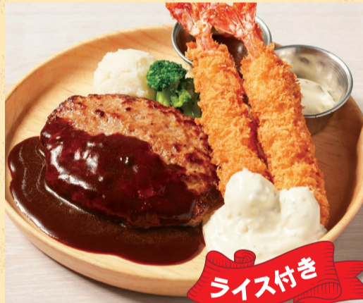
キャンプバーグ&エビフライ ¥1,880