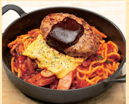
ナポリタン&ミニハンバーグ ¥1,680