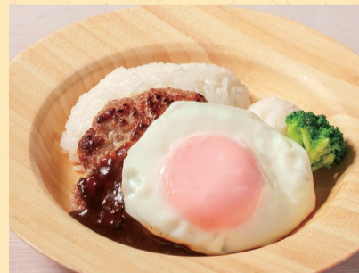
キッズエッグバーグ ¥900