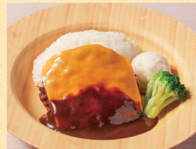
キッズチーズバーグ ¥900