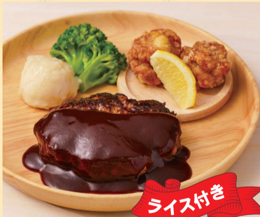
キャンプバーグ&からあげ ¥1,580