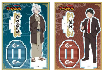
アクリルスタンド 2種 各1,650円