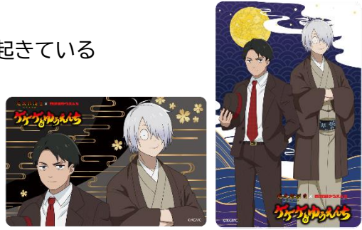
ノベルティカード 全2種