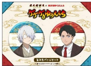
ゲゲのゆうえんち缶バッジ2個セット 1,100円