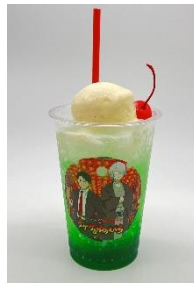
ゲゲのゆうえんち コラボクリームソーダ 850円