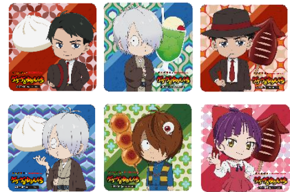
限定ノベルティコースター 全6種