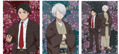
限定ポストカード 全3種

西武園ゆうえんちの入園とアトラクションが乗り放題のチケット「1日レジャー切符」にゲゲゲのゆうえんち限定の特典がついた、「ゲゲゲのゆうえんち限定 特典付き1日レジャー切符」を販売。周遊ラリー「夕日の丘怪奇譚」シートと限定ポストカード(全3種) ※1 がついています！