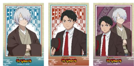
限定フォト風カード 全3種