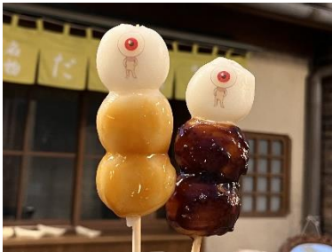
目玉おやじの秘伝団子 5種 各700円

夕日の丘商店街にある団子屋鶴龜堂では、お団子に目玉おやじがプリントされた「目玉おやじの秘伝団子」(所澤のせうゆ焼き・みたらし・くるみ入り江戸甘味噌・さやま茶・黒みつきな粉だんご)が登場！ファンはもちろん、あまり作品を知らない方でも思わず手にして食べたくなる一品です！「ゲゲのゆうえんち コラボクリームソーダ」は鬼太郎の父と母の名シーンを再現できるフォトスポットにテイクアウトするのもオススメです。コラボフード1点ご購入につき限定ノベルティコースター(全6種)を1枚プレゼント※1！※1ランダムでのお渡しとなり選べません