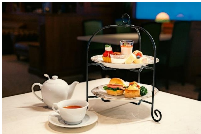
アフタヌーンティーセット