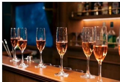
ウェルカムドリンク