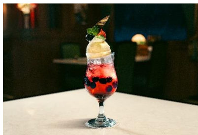
スペシャルドリンク